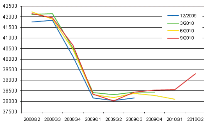
Kuvio 1. Bruttokansantuotteen kausitasoitettun volyymin tarkentuminen Neljännesvuositilinpäivän julkaisuissa

Myös muut Euroopan taloudet ovat pikku hiljaa toipumassa taantumasta. Vuoden toisella neljänneksellä bruttokansantuote kasvoi Eurostatin kokoamien ennakotietojen mukaan EU-alueella 1,0 prosenttia edellisestä neljänneksestä ja 1,9 prosenttia vuoden takaisesta.